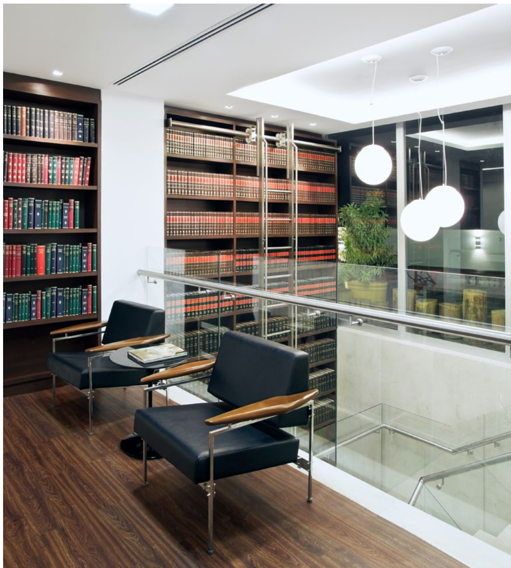
BIBLIOTECA DE PINHEIRO NETO ADVOGADOS NO RIO DE JANEIRO.