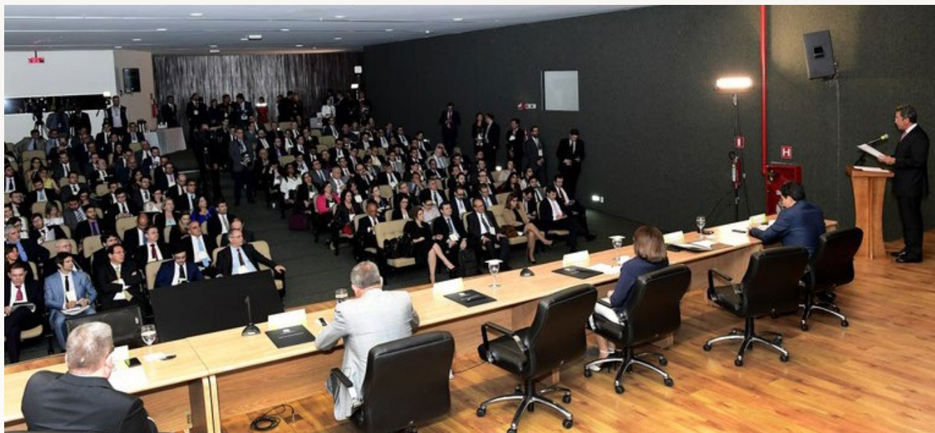
I JORNADA DE DIREITO PROCESSUAL CIVIL