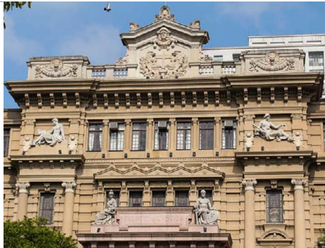
TRIBUNAL DE JUSTIÇA DO ESTADO DE SÃO PAULO (FOTO: DIVULGAÇÃO).

FONTE: PROCESSO Nº. 1037151-18.2016.8.26.0100, 1ª CÂMARA RESERVADA DE DIREITO EMPRESARIAL DO TJSP. ■